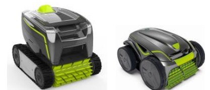
Robot Robot GT3220/GV3420