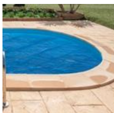
Cubierta isotérmica Isothermic cover CVPE500