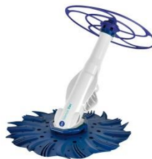
Limpiafondos automático Automatic cleaner 90397