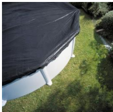
Cubierta de invierno Winter cover CIPR301