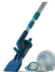
Limpiafondos Ventury Ventury vacuum Y15