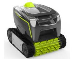
Robot Robot GT2120 / GT3220