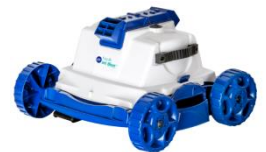
Robot Robot RKJ14