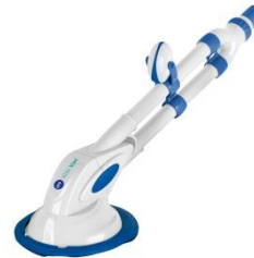
Limpiafondos automático Automatic cleaner 90399